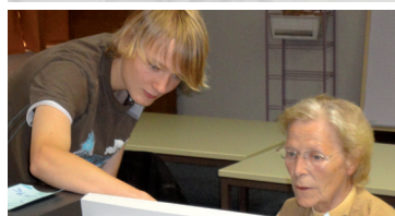
Jung für Alt