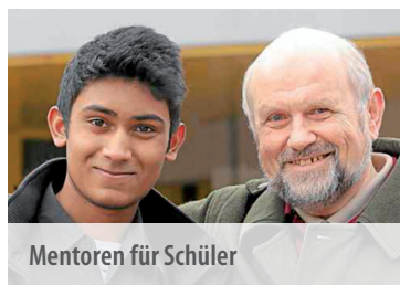
Mentoren für Schüler